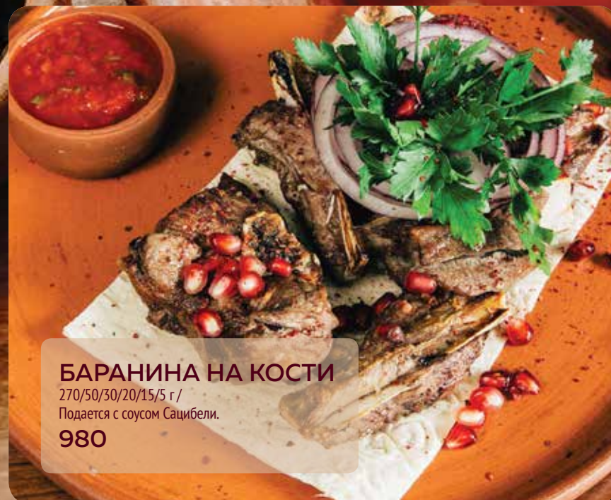
БАРАНИНА НА КОСТИ 270/50/30/20/15/5 г / Подается с соусом Сацибели. 980