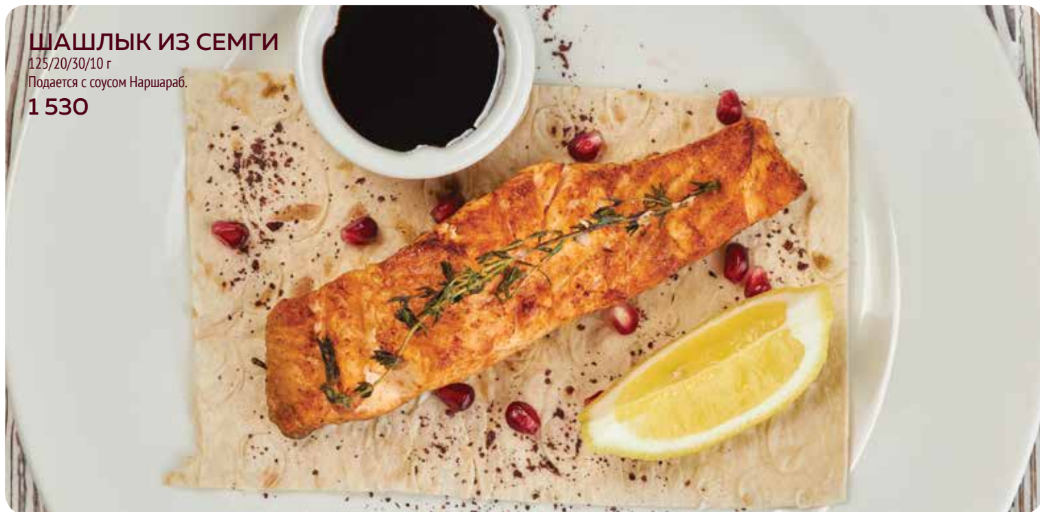
ШАШЛЫК ИЗ СЕМГИ 125/20/30/10 г Подается с соусом Наршараб. 1 530