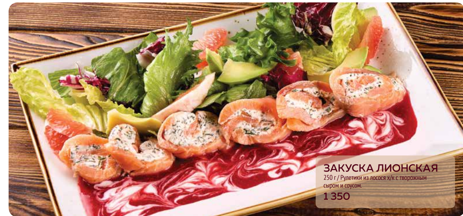
ЗАКУСКА ЛИОНСКАЯ 250 г / Рулетики из лосося х/к с творожным сыром и соусом. 1 350