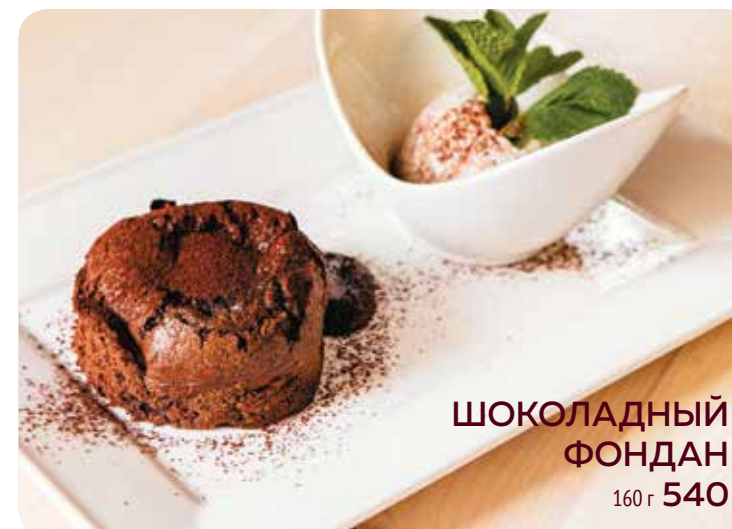
ШОКОЛАДНЫЙ ФОНДАН 160 г 540