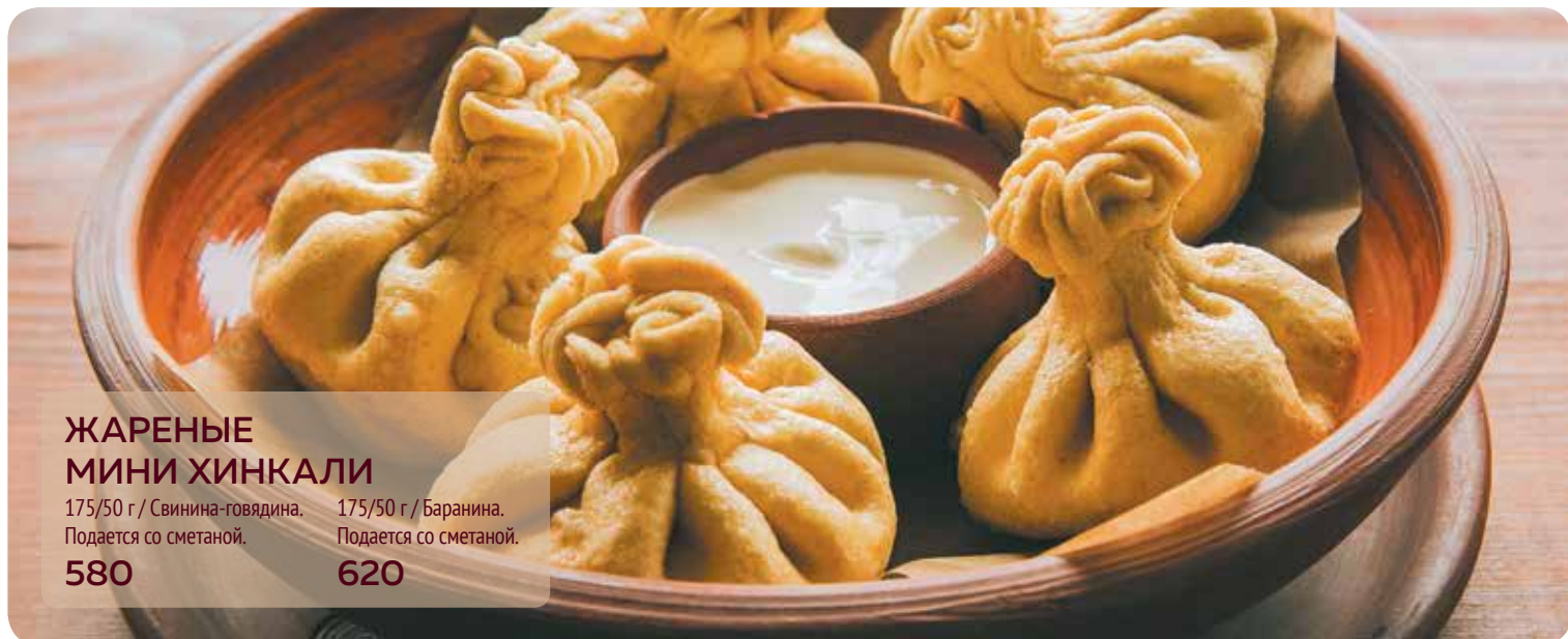
ЖАРЕННЫЕ МИНИ ХИНКАЛИ 175/50 г / Свинина-говядина. 175/50 г / Баранина. Подается со сметаной. Подается со сметаной. 580 620