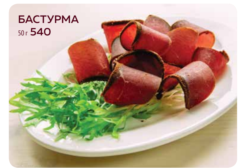
БАСТУРМА 50 г 540