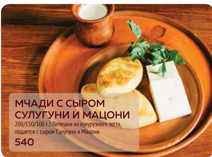
МЧАДИ С СЫРОМ СУЛУГУНИ И МАЦОНИ 200/150/100 г / Лепешки из кукурузного теста, подается с сыром Сулугуни и Мацони. 540