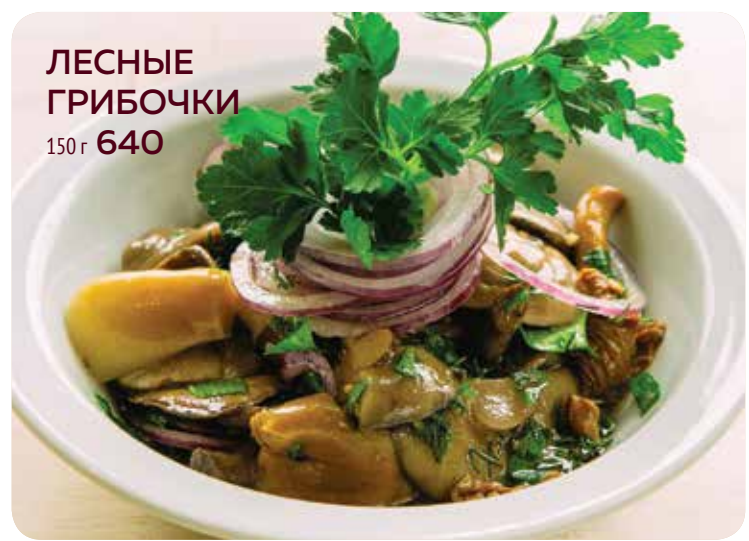
ЛЕСНЫЕ ГРИБОЧКИ 150 г 640