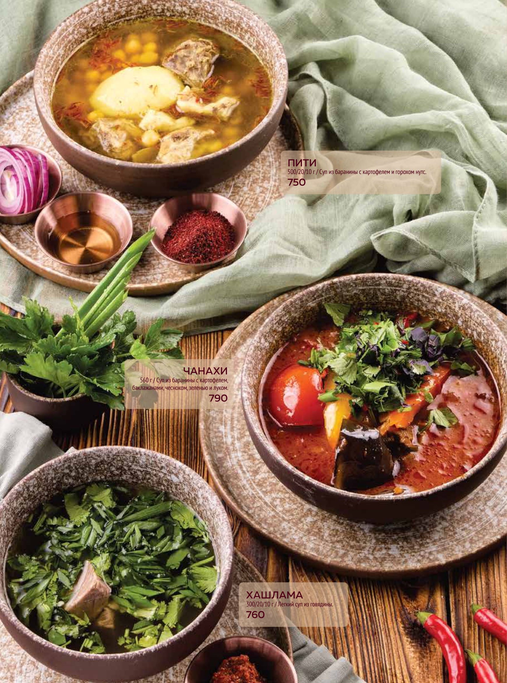
ПИТИ 500/20/10 г / Суп из баранины с картофелем и горохом нут. 750