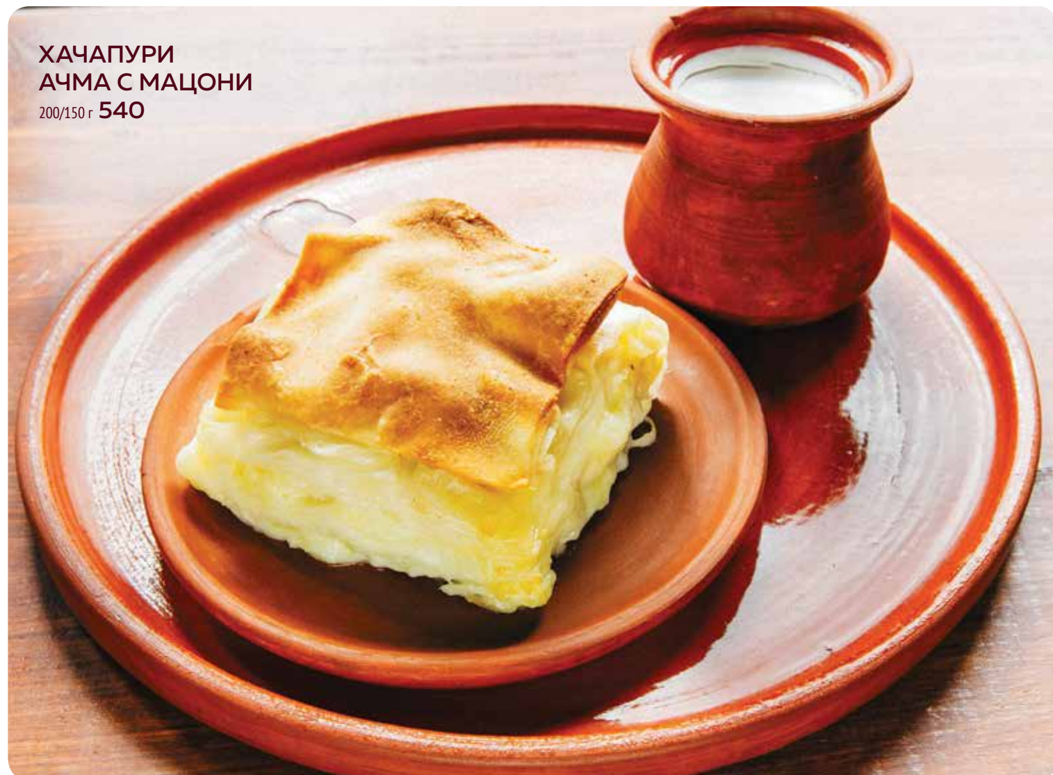
ХАЧАПУРИ АЧМА С МАЦОНИ 200/150 г 540