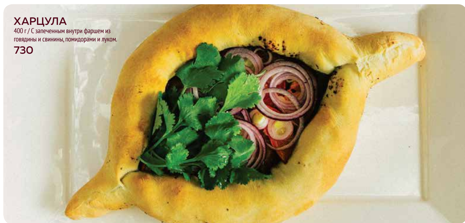
ХАРЦУЛА 400 г / С запеченным внутри фаршем из говядины и свинины, помидорами и луком. 730