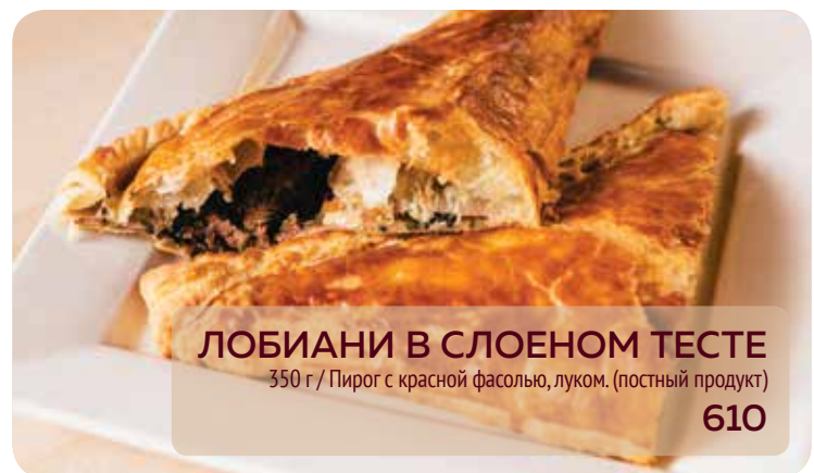
ЛОБИАНИ В СЛОЕНОМ ТЕСТЕ 350 г / Пирог с красной фасолью, луком. (постный продукт) 610