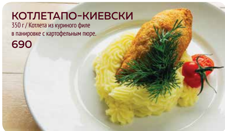
КОТЛЕТАПО-КИЕВСКИ 350 г / Котлета из куриного филе в панировке с картофельным пюре. 690