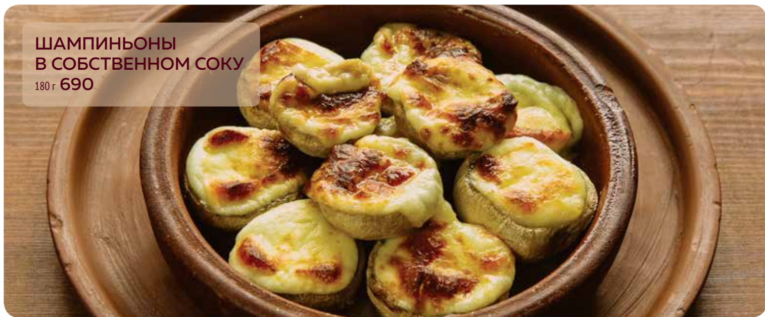
ШАМПИНЬОНЫ В СОБСТВЕННОМ СОКУ 180 г 690