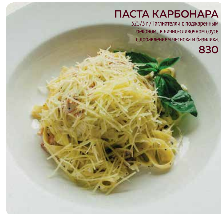
ПАСТА КАРБОНАРА 325/3 г / Таглиателли с поджаренным беконом, в яично-сливочном соусе с добавлением чеснока и базилика. 830