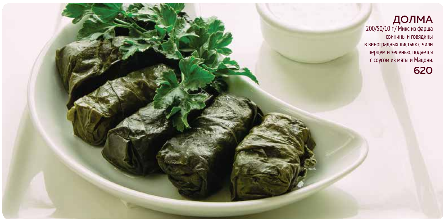
ДОЛМА 200/50/10 г / Микс из фарша свинины и говядины в виноградных листьях с чили перцем и зеленью, подается с соусом из мяты и Мацони. 620