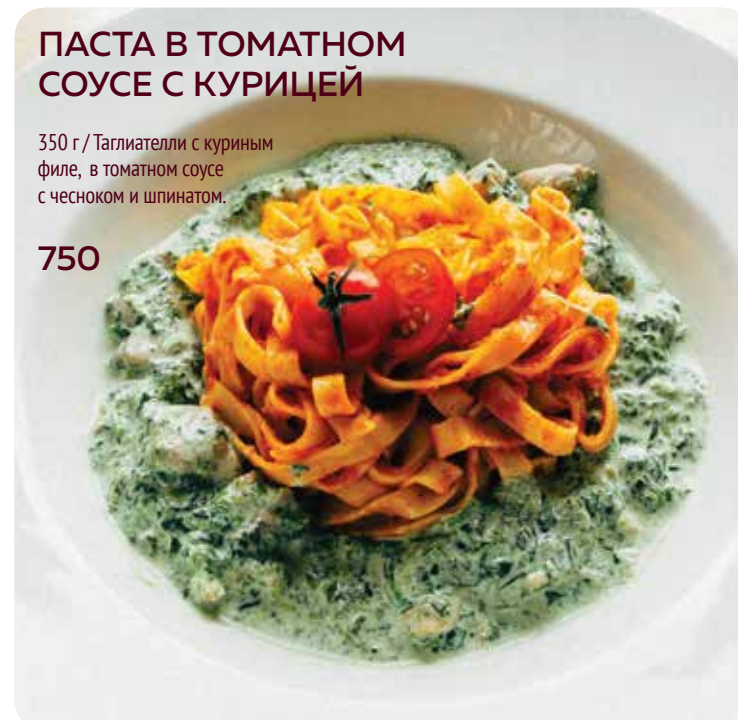
ПАСТА В ТОМАТНОМ СОУСЕ С КУРИЦЕЙ 350 г / Таглиателли с куриным филе, в томатном соусе с чесноком и шпинатом. 750