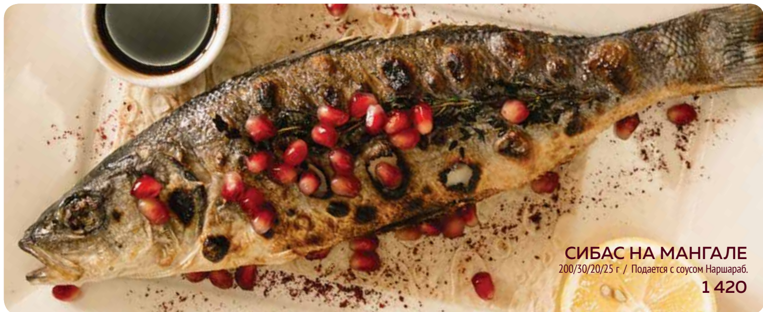
СИБАС НА МАНГАЛЕ 200/30/20/25 г / Подается с соусом Наршараб. 1 420