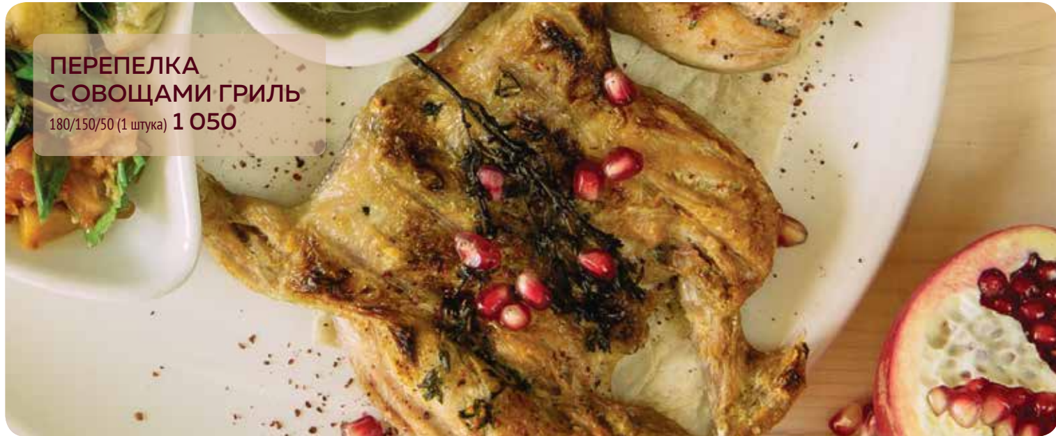
ПЕРЕПЕЛКА С ОВОЩАМИ ГРИЛЬ 180/150/50 (1 штука) 1 050

Уважаемые гости! Если у вас есть аллергия на какой-либо пищевой продукт, просьба сообщить об этом вашему официанту.