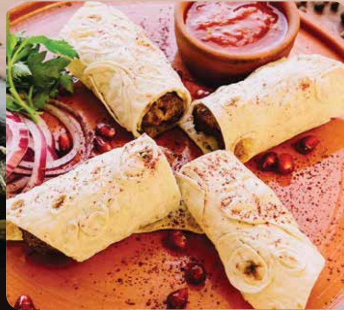
ЛЮЛЯ-КЕБАБ ИЗ ТЕЛЯТИНЫ 200/40/30/15/15/5 г / 1 450

ВСЕ МЯСНЫЕ БЛЮДА ПОДАЮТСЯ С СОУСОМ САЦИБЕЛИ.