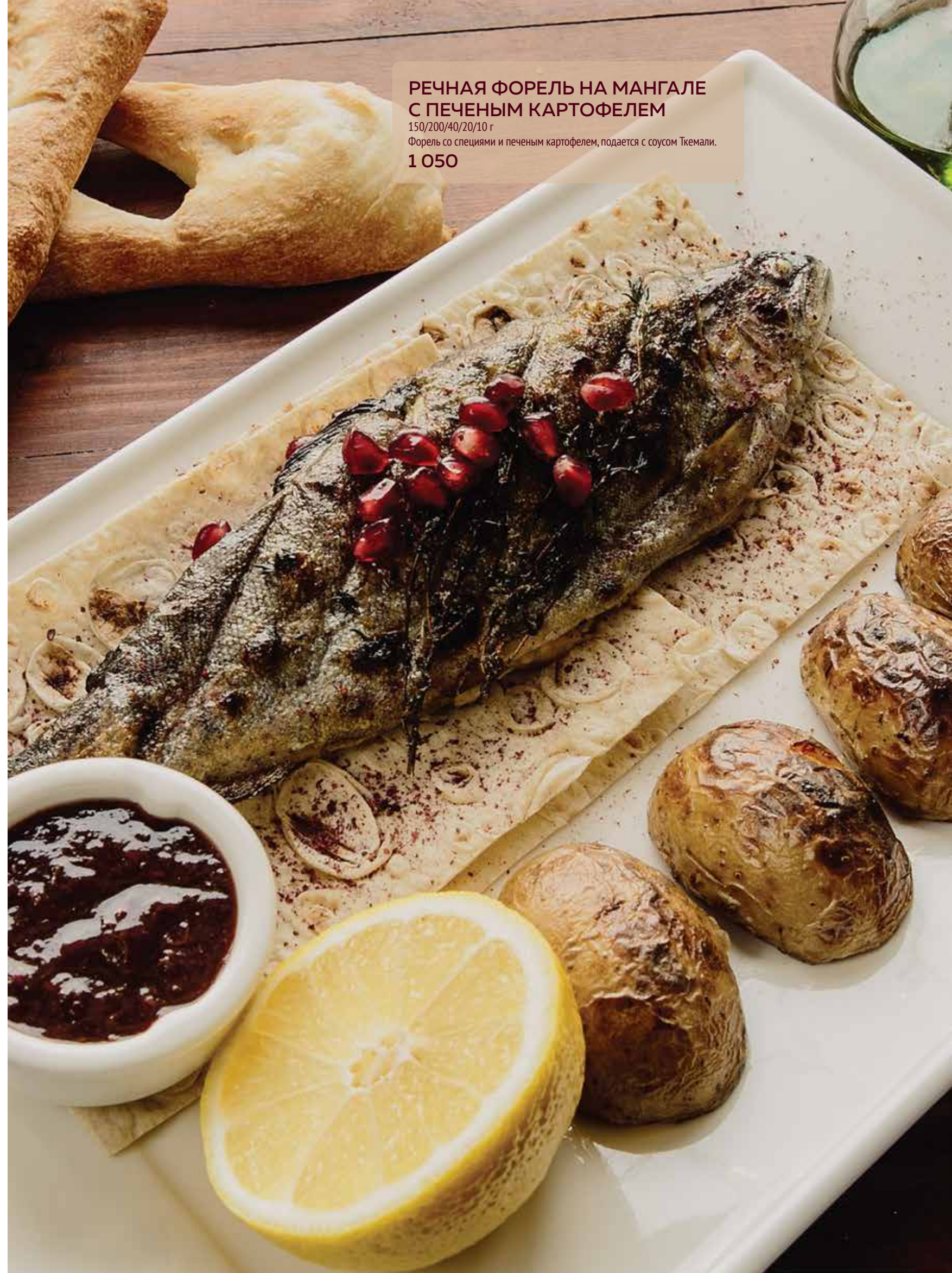
РЕЧНАЯ ФОРЕЛЬ НА МАНГАЛЕ С ПЕЧеныМ КАРТОФЕЛЕМ 150/200/40/20/10 г Форель со специями и печеным картофелем, подается с соусом Ткемали. 1 050