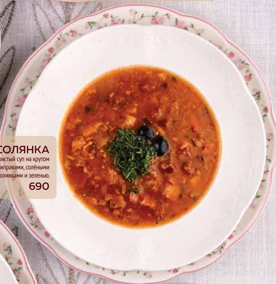
СОЛЯНКА 400/40/20 г / Традиционный наваристый суп на крутом мясном бульоне с копченостями, приправами, солёными огурчиками, оливками и зеленью. 690