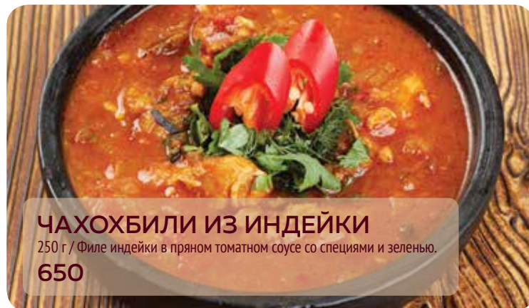
ЧАХОХБИЛИ ИЗ ИНДЕЙКИ 250 г / Филе индейки в пряном томатном соусе со специями и зеленью. 650