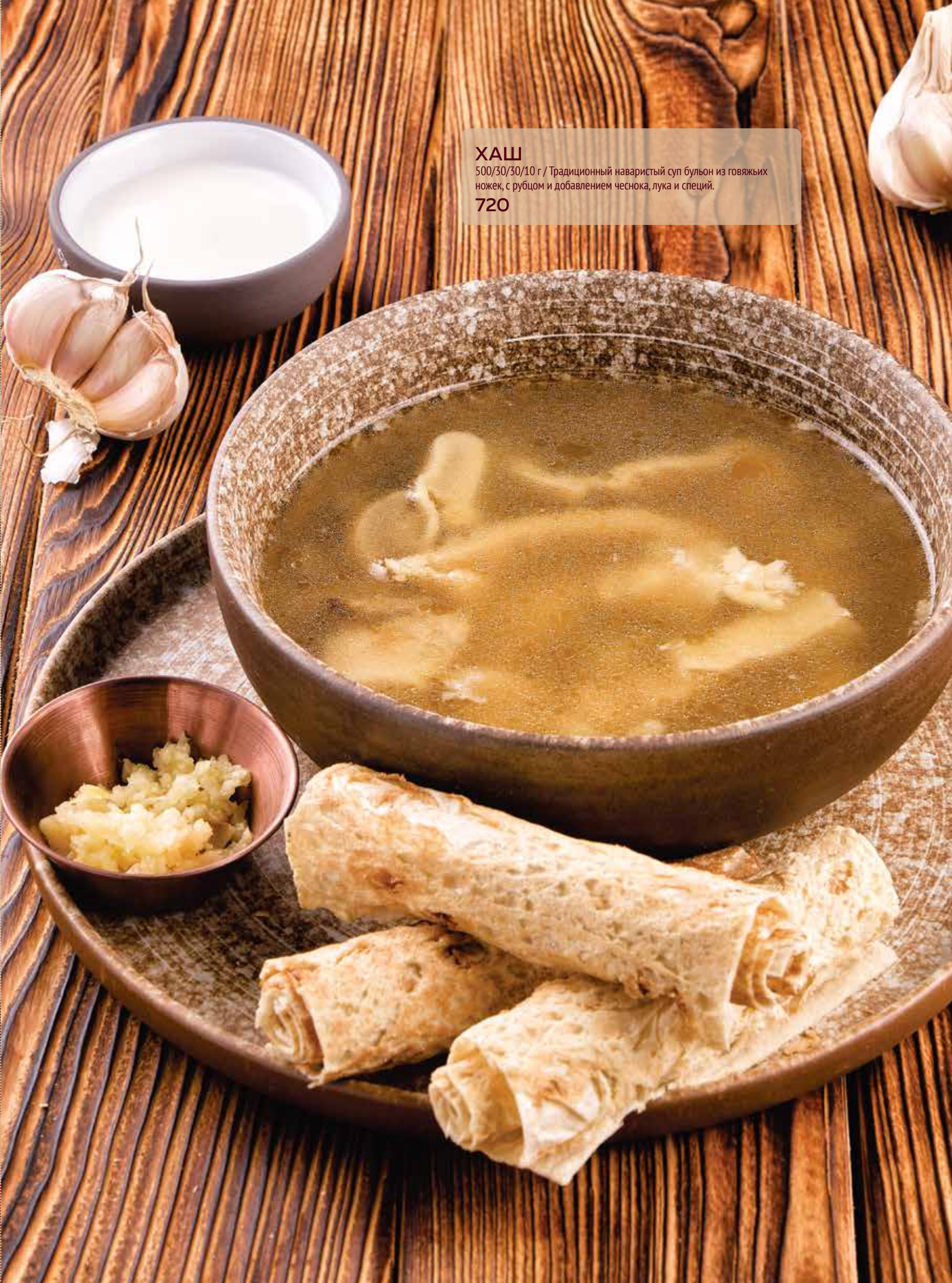
ХАШ 500/30/30/10 г / Традиционный наваристый суп бульон из говяжьих ножек, с рубцом и добавлением чеснока, лука и специй. 720