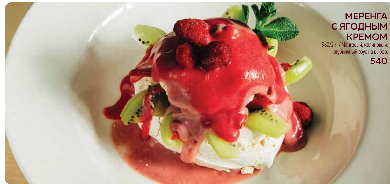
МЕРЕНГА С ЯГОДНЫМ КРЕМОМ 360/2 г / Манговый, малиновый, клубничный соус на выбор. 540