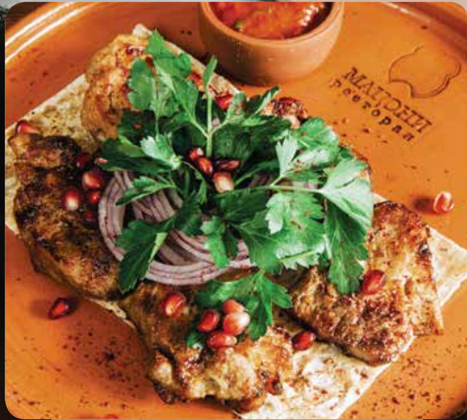
ШАШЛЫК ИЗ СВИНИНЫ 200/40/30/10/10/5 г / 720