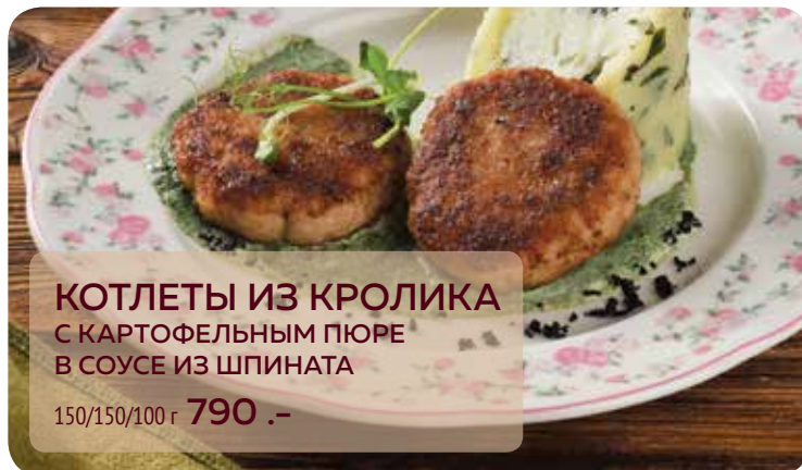
КОТЛЕТЫ ИЗ КРОЛИКА С КАРТОФЕЛЬНЫМ ПЮРЕ В СОУСЕ ИЗ ШПИНАТА 150/150/100 г 790 .-