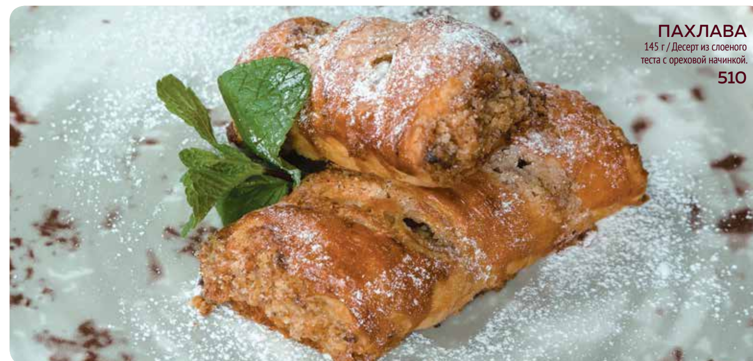
ПАХЛАВА 145 г / Десерт из слоеного теста с ореховой начинкой. 510