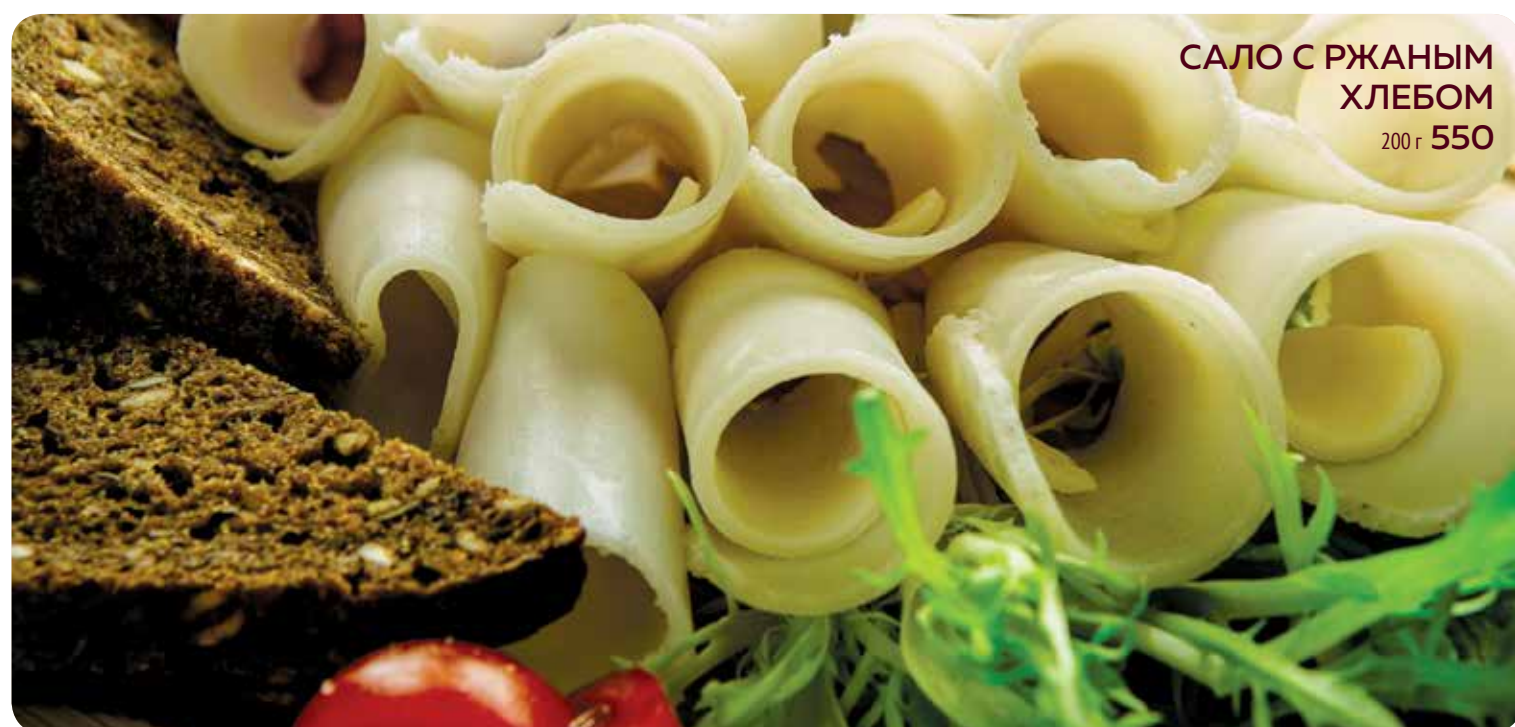
САЛО С РЖАНЫМ ХЛЕБОМ 200 г 550