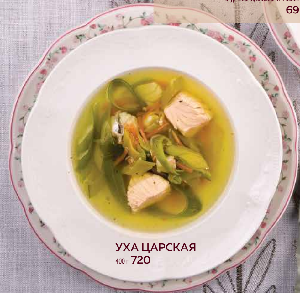
УХА ЦАРСКАЯ 400 г 720