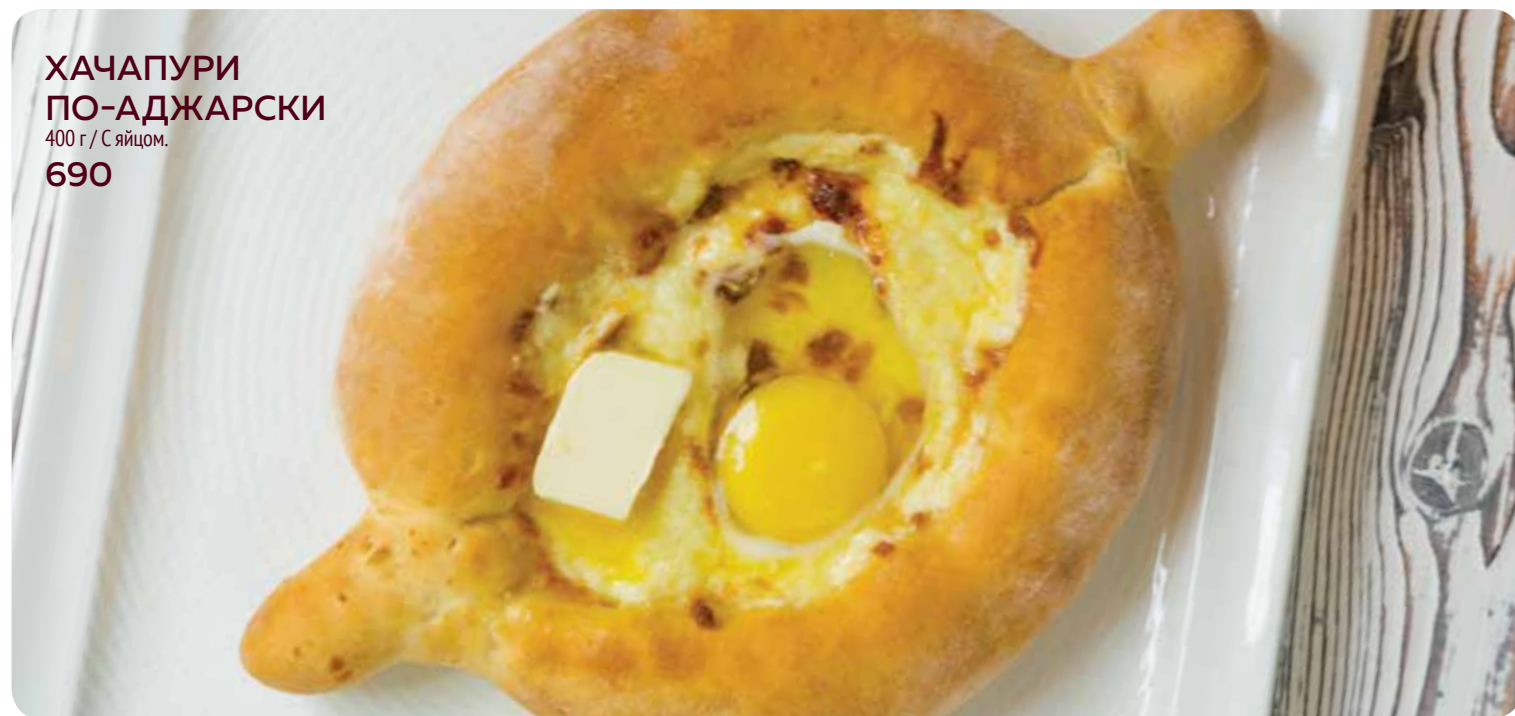
ХАЧАПУРИ ПО-АДЖАРСКИ 400 г / С яйцом. 690