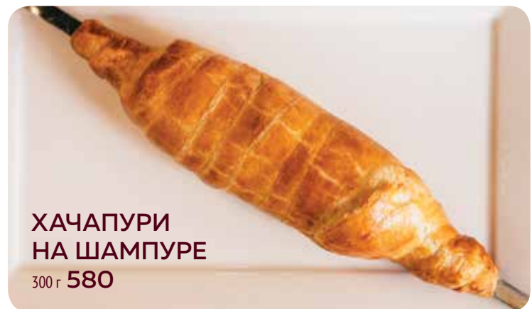
ХАЧАПУРИ НА ШАМПУРЕ 300 г 580