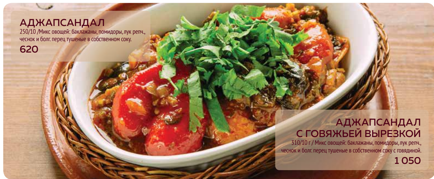
АДЖАПСАНДАЛ 250/10 /Микс овощей: баклажаны, помидоры, лук репч., чеснок и болгар. перец тушеные в собственном соку. 620