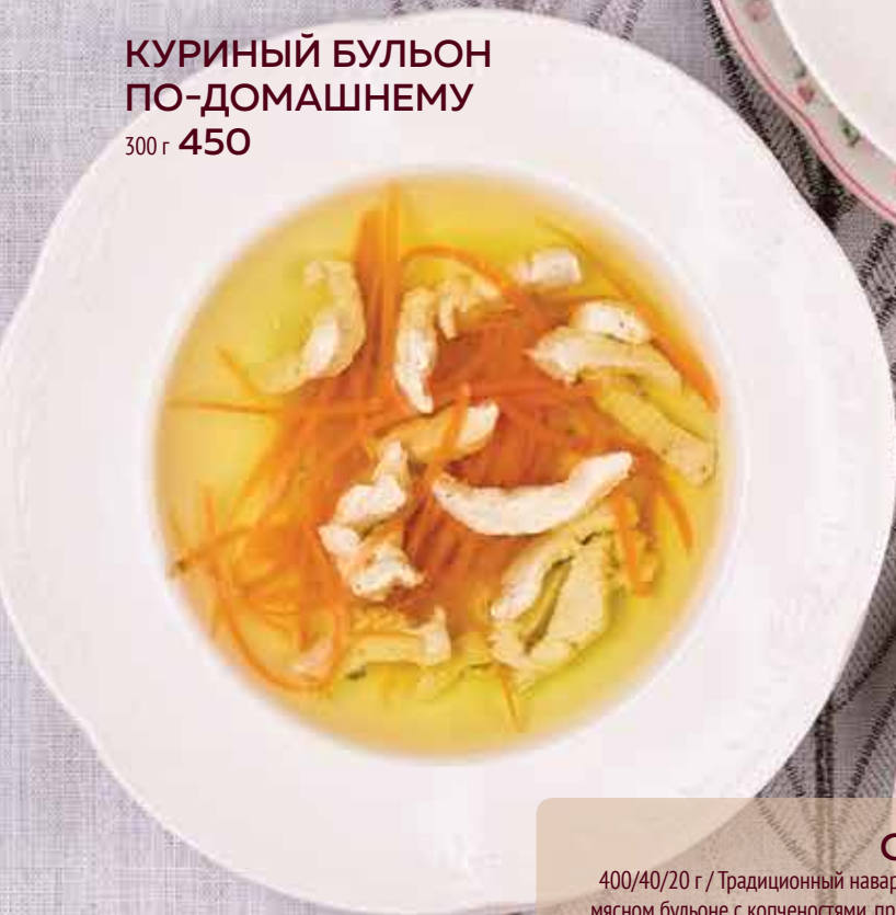
КУРИНЫЙ БУЛЬОН ПО-ДОМАШНЕМУ 300 г 450