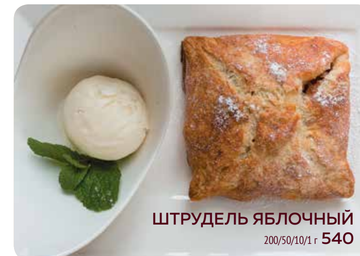
ШТРУДЕЛЬ ЯБЛОЧНЫЙ 200/50/10/1 г 540