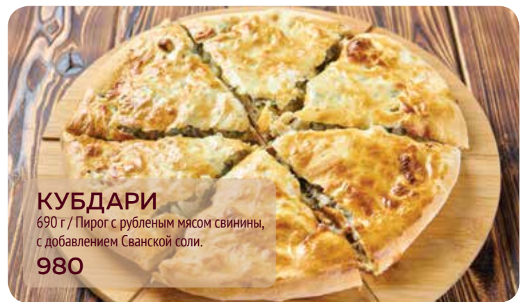
КУБДАРИ 690 г / Пирог с рубленным мясом свинины, с добавлением Сванской соли. 980