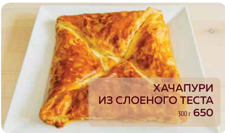
ХАЧАПУРИ ИЗ СЛОЕНОГО ТЕСТА 300 г 650