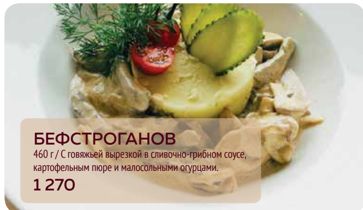
БЕФСТРОГАНОВ 460 г / С говяжьей вырезкой в сливочно-грибном соусе, картофельным пюре и малосольными огурцами. 1 270