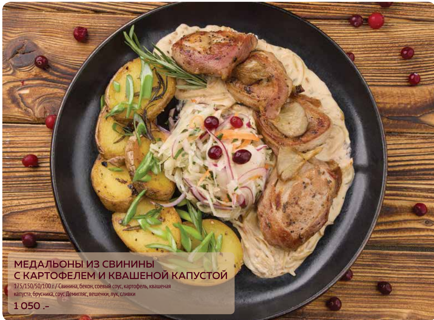
МЕДАЛЬОНЫ ИЗ СВИНИНЫ С КАРТОФЕЛЕМ И КВАШЕНОЙ КАПУСТОЙ 175/150/50/100 г / Свинина, бекон, соевый соус, картофель, квашеная капуста, брусника, соус Демиглас, вешенки, лук, сливки 1 050 .-