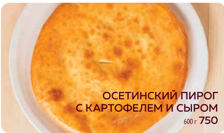
ОСЕТИНСКИЙ ПИРОГ С КАРТОФЕЛЕМ И СЫРОМ 600 г 750