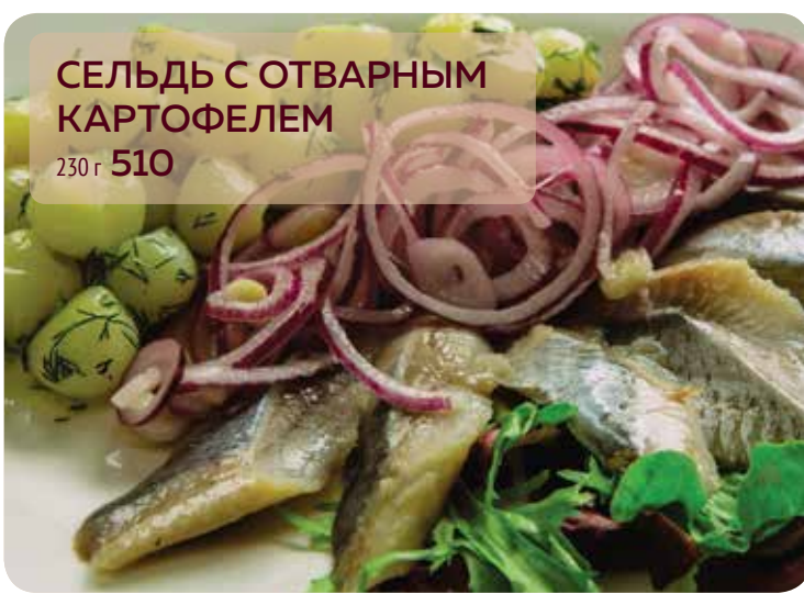
СЕЛЬДЬ С ОТВАРНЫМ КАРТОФЕЛЕМ 230 г 510