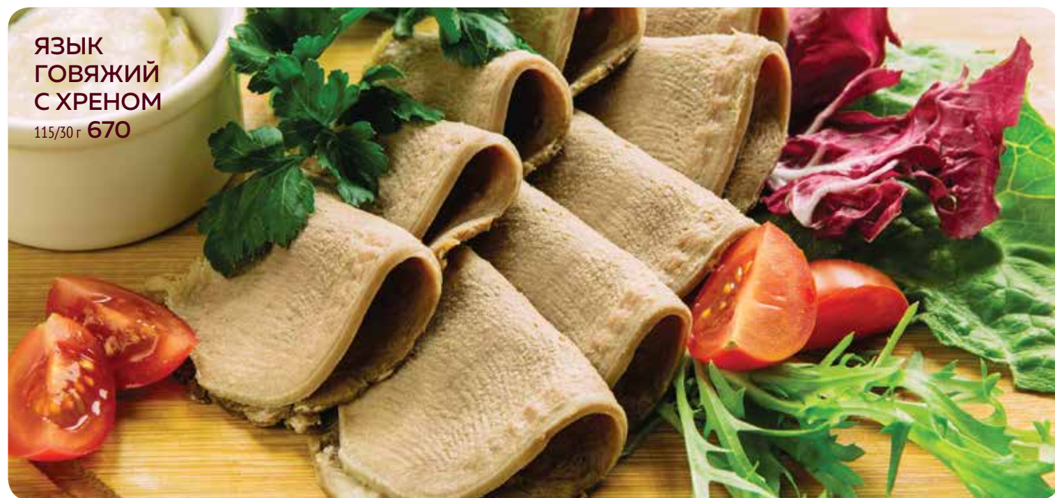
ЯЗЫК ГОВЯЖИЙ С ХРЕНОМ 115/30 г 670

Уважаемые гости! Если у вас есть аллергия на какой-либо пищевой продукт, просьба сообщить об этом вашему официанту.