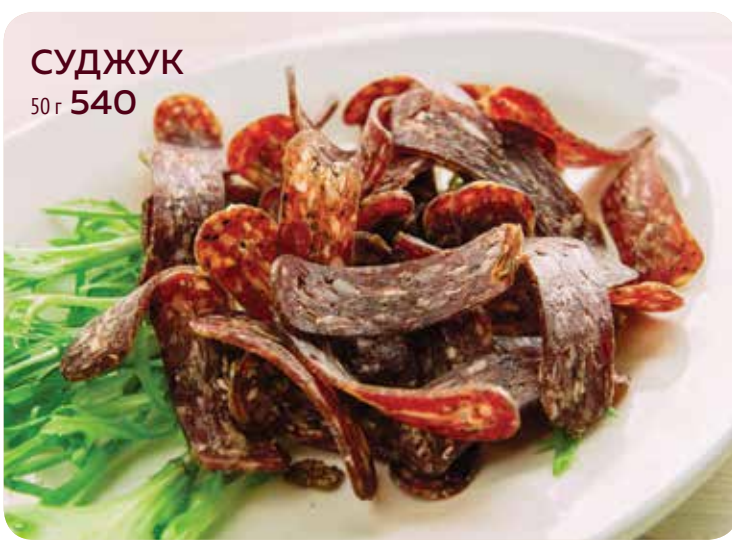
СУДЖУК 50 г 540