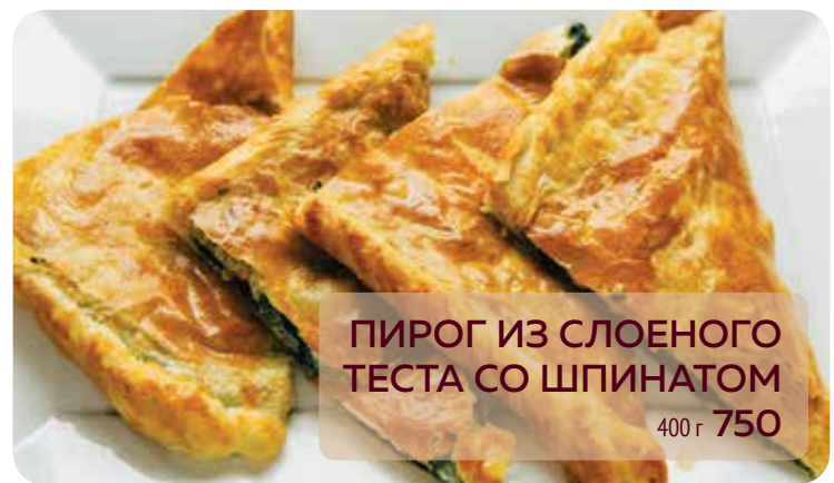
ПИРОГ ИЗ СЛОЕНОГО ТЕСТА СО ШПИНАТОМ 400 г 750