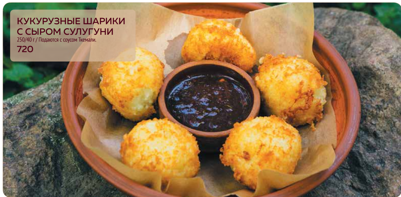
КУКУРУЗНЫЕ ШАРИКИ С СЫРОМ СУЛУГУНИ 250/40 г / Подаются с соусом Ткемали. 720