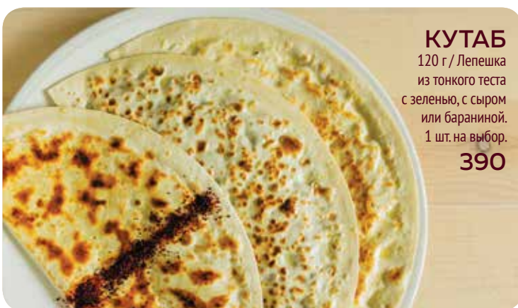
КУТАБ 120 г / Лепешка из тонкого теста с зеленью, с сыром или бараниной. 1 шт. на выбор. 390