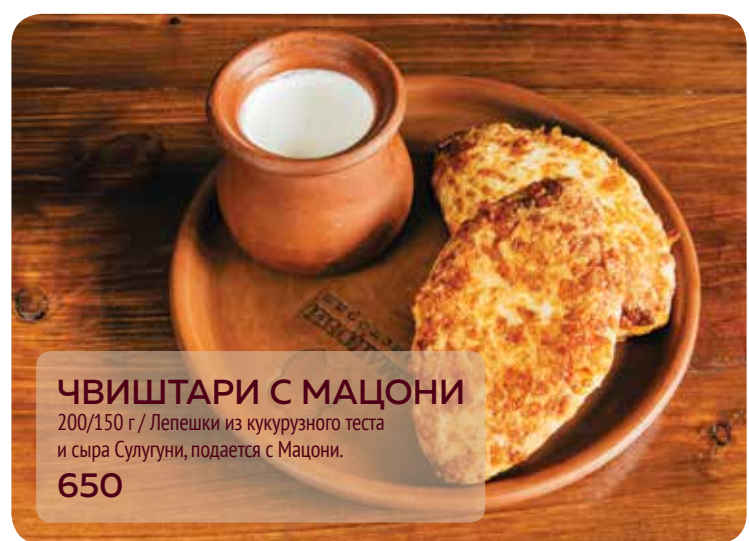
ЧВИШТАРИ С МАЦОНИ 200/150 г / Лепешки из кукурузного теста и сыра Сулугуни, подается с Мацони. 650