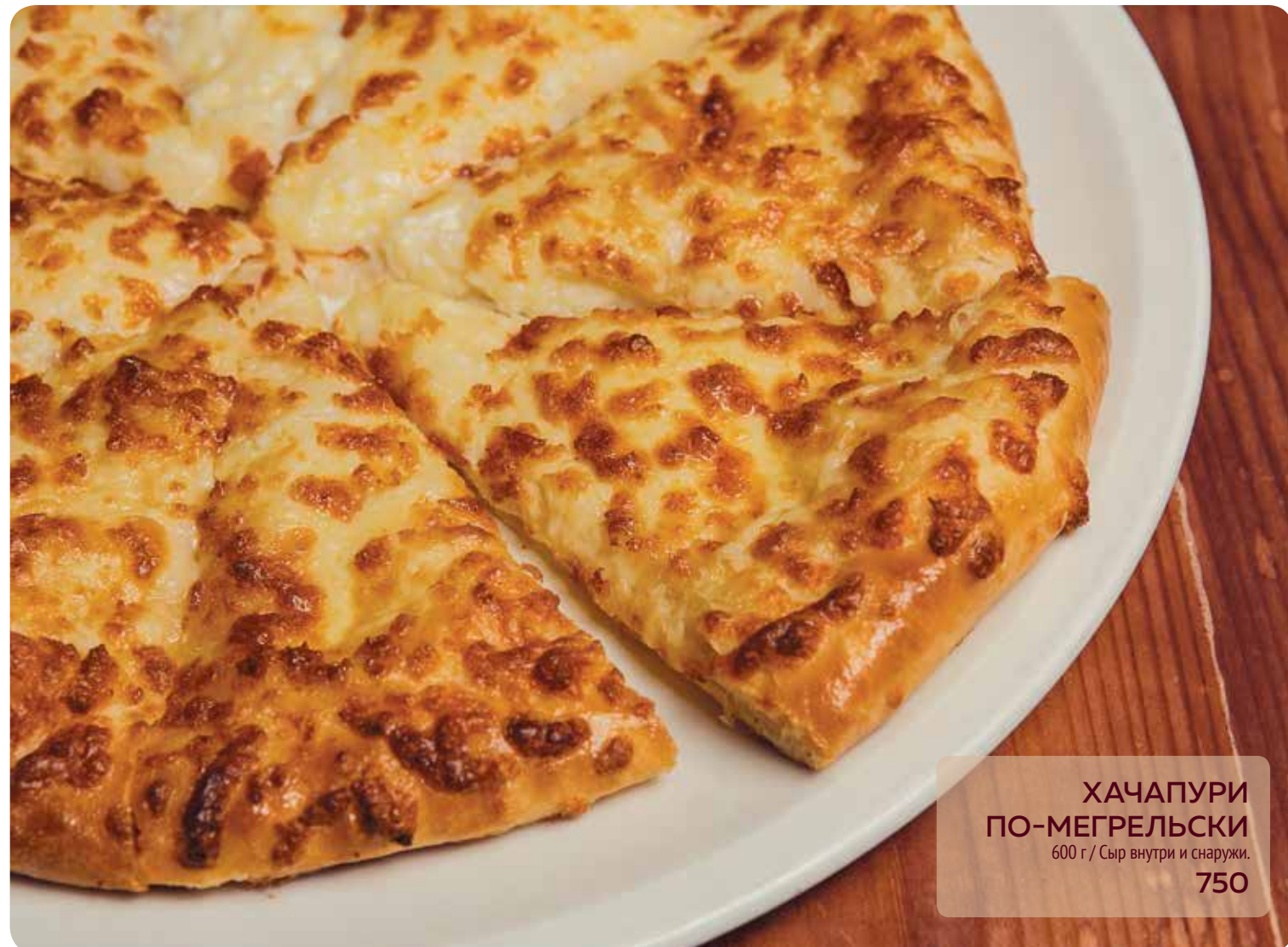
ХАЧАПУРИ ПО-МЕГРЕЛЬСКИ 600 г / Сыр внутри и снаружи. 750