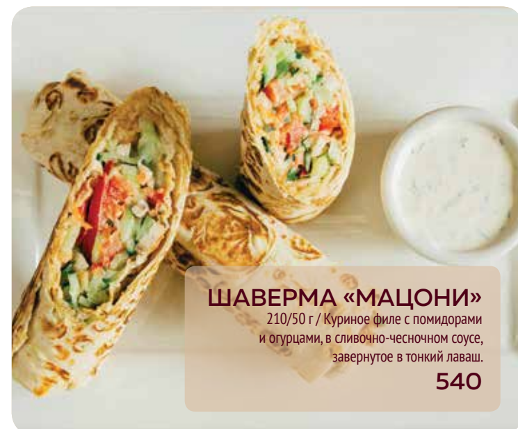
ШАВЕРМА «МАЦОНИ» 210/50 г / Куриное филе с помидорами и огурцами, в сливочно-чесночном соусе, завернутое в тонкий лаваш. 540