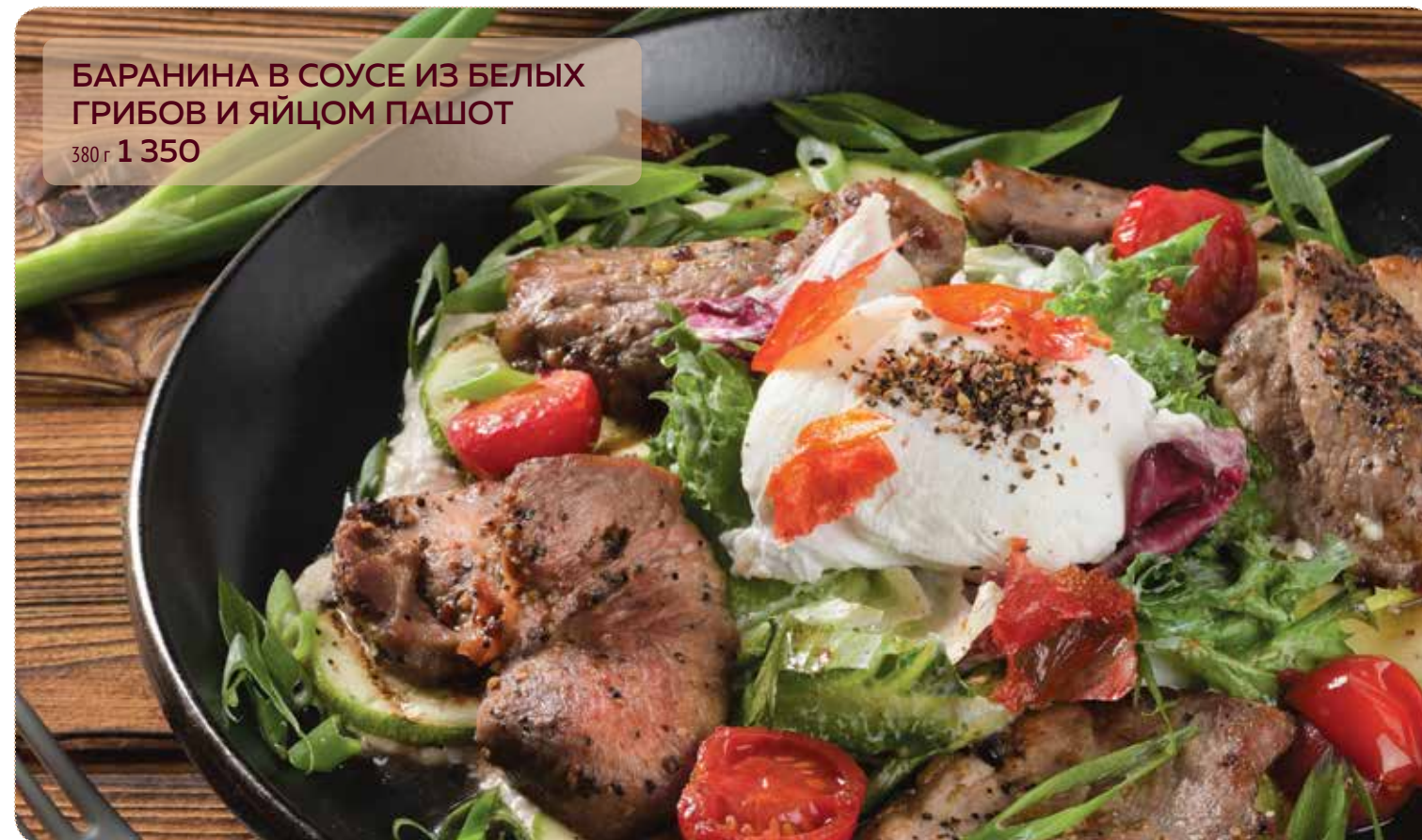
БАРАНИНА В СОУСЕ ИЗ БЕЛЫХ ГРИБОВ И ЯЙЦОМ ПАШОТ 380 г 1 350