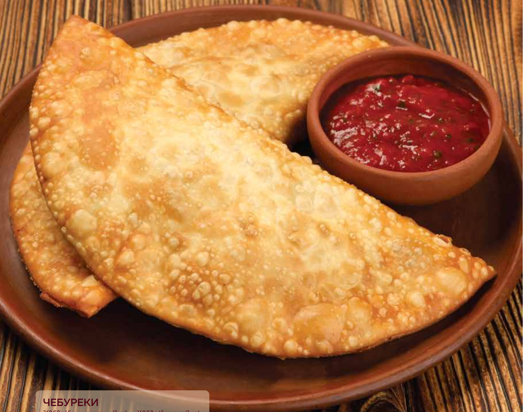
ЧЕБУРЕКИ 260/50 г / Свинина-говядина (2 шт.) 260/50 г / Баранина (2 шт.) 510 530