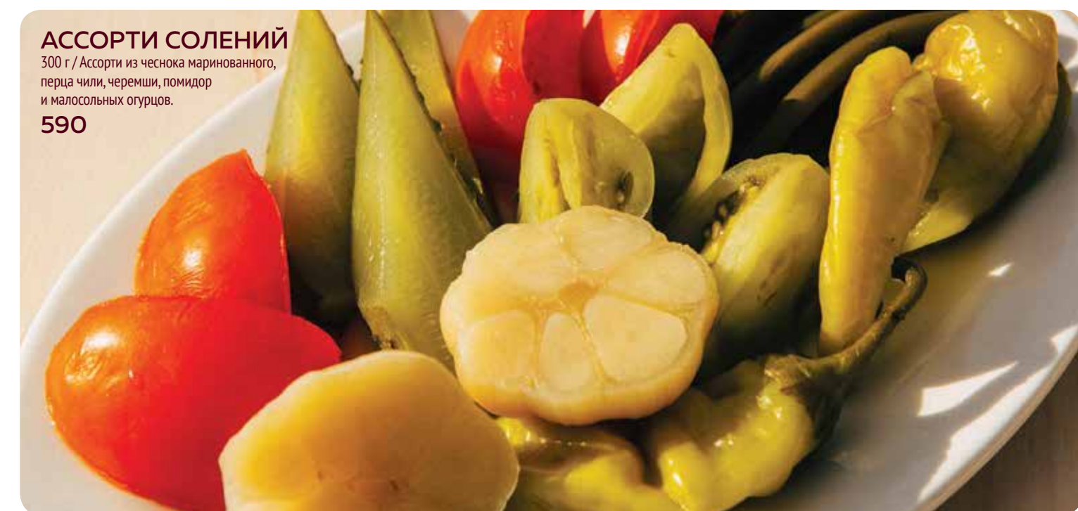
АССОРТИ СОЛЕНИЙ 300 г / Ассорти из чеснока маринованного, перца чили, черемши, помидор и малосольных огурцов. 590

Уважаемые гости! Если у вас есть аллергия на какой-либо пищевой продукт, просьба сообщить об этом вашему официанту.