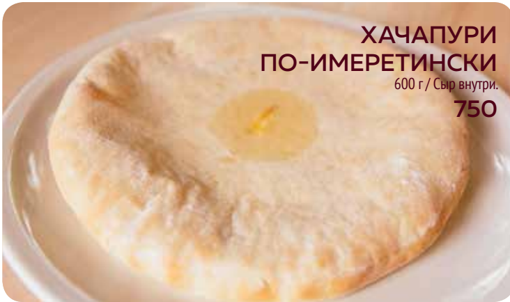
ХАЧАПУРИ ПО-ИМЕРЕТИНСКИ 600 г / Сыр внутри. 750