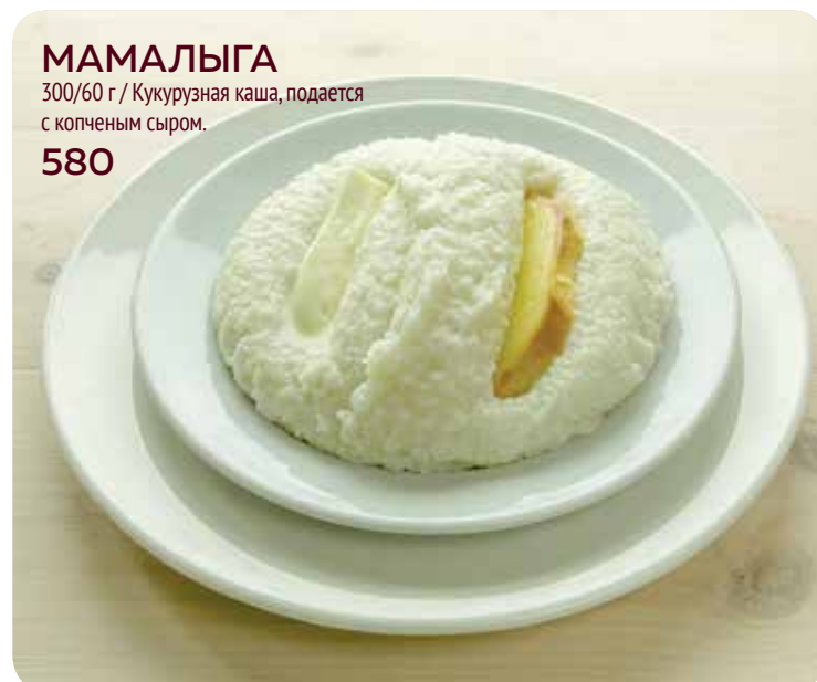
МАМАЛЫГА 300/60 г / Кукурузная каша, подается с копченым сыром. 580