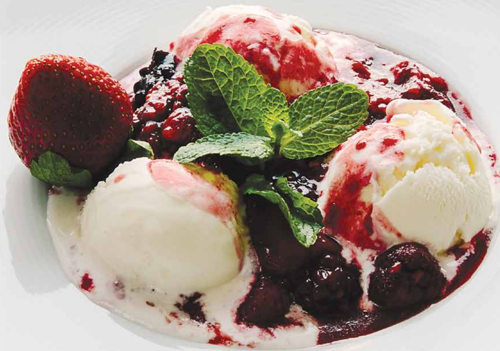
МОРОЖЕНОЕ С ЯГОДАМИ ПО-ДОМАШНЕМУ 280/2 г 610